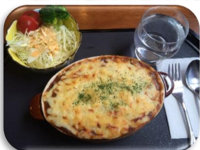
陣屋焼カレー 700 円