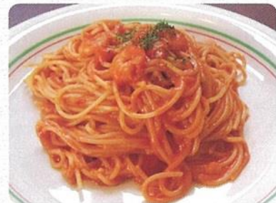
パスタ 650 円