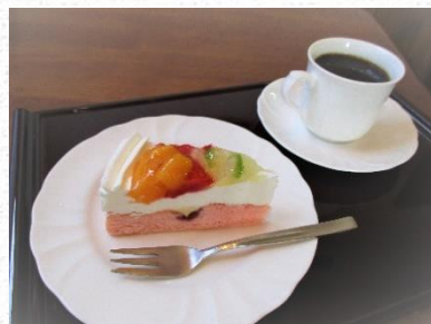
各種ケーキセット 500 円