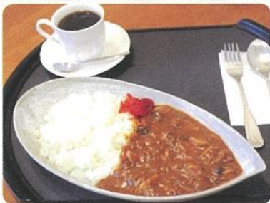
陣屋カレーセット 850 円